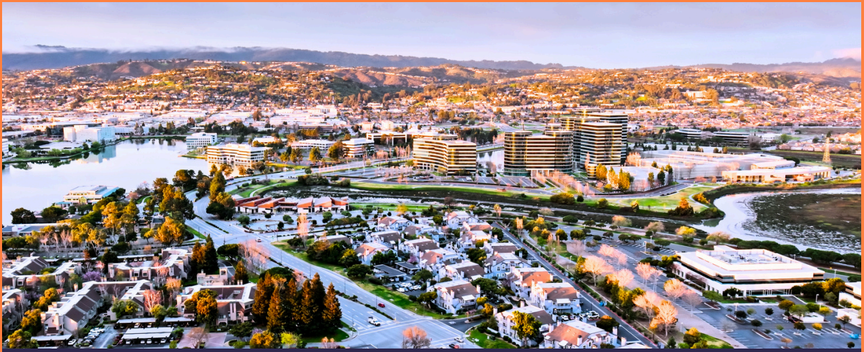
矽谷之旅 Silicon Valley