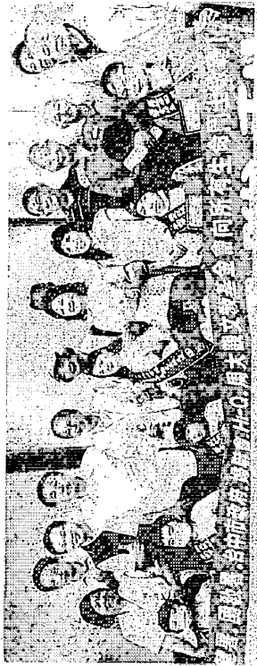
▲周大觀文教基金會昨天在臺中市政府陽明大樓，頒發生命鬥士獎章給臺中市的六名得主。

臺中市今年得主共有兩名幼兒、兩名國小學生、一名高中生、兩名國中學生。 周大觀文教基金會昨天在臺中市政府頒發「生命鬥士獎章」給臺中市的六名得主。該基金會今年從臺灣各縣市和港澳地區共選出三百多名抗癌鬥士，並頒發每人兩萬元獎學金，鼓勵他們勇敢抗癌的精神。為避免抗癌鬥士奔波，基金會採取在各縣市頒獎，或多個縣市得獎者一起頒獎的模式，下個月將在臺北市頒獎給屏東、花蓮、臺東的得主。